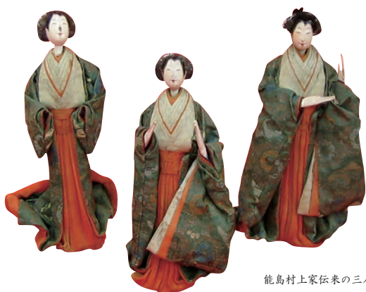
能島村上家伝来の三人官女

2月27日(土)～4月3日(日) 9:00～17:00 (入館は16:30まで)